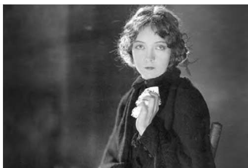
True Heart Susie (D. W. Griffith, 1918) © FPA Classics Way Down East (D. W. Griffith, 1920) © FPA Classics The White Sister (Henry King, 1923) © UCLA