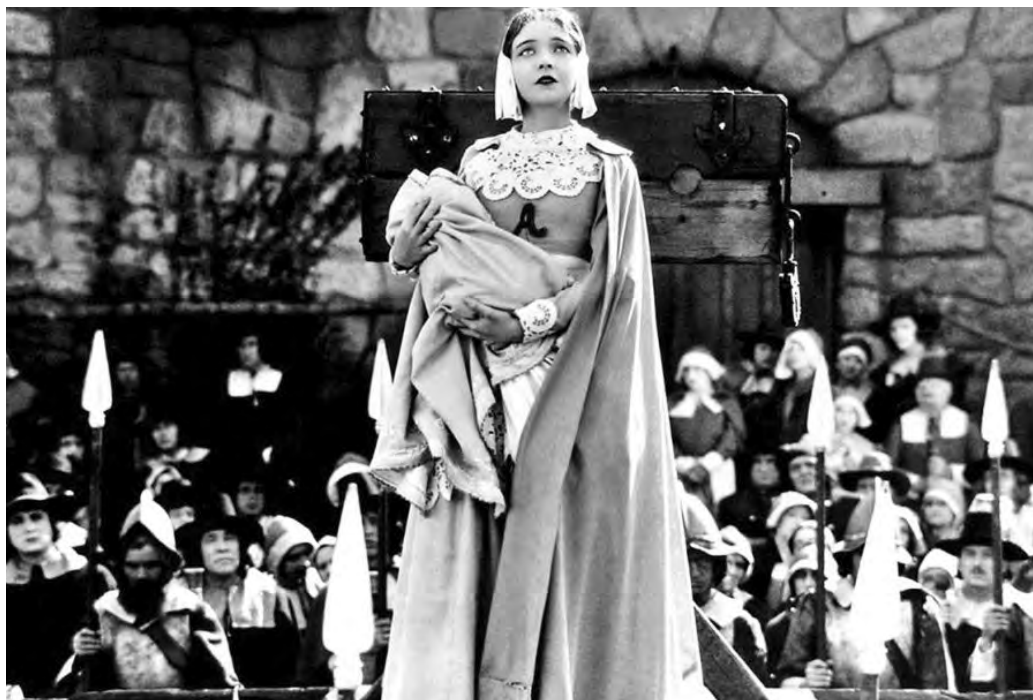
The Scarlet Letter (Victor Seastrom, 1926)