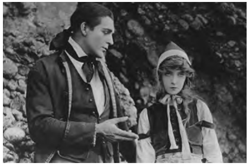
The Mothering Heart (D.W. Griffith, 1913) The Lady and the Mouse (D. W. Griffith, 1913) Enoch Arden (Christy Cabane, 1915)