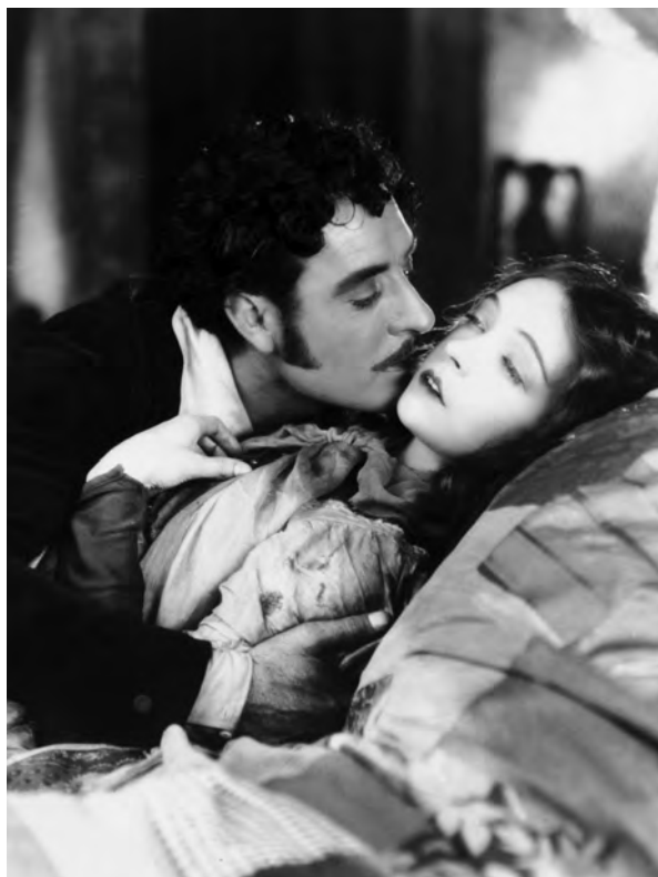
La Bohème (King Vidor, 1926)