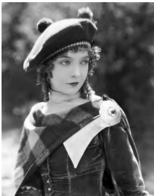
Annie Laurie (John S. Robertson, 1927)

Lillian Gish est l'une des stars du cinéma américain qui a le plus fasciné le public tout au long de ses 75 ans de carrière. Qualifiée « d'institution américaine » par le critique de théâtre américain Brooks Atkinson, celle qui a été une pionnière de l'art cinématographique et l'une des plus grandes actrices de l'ère du cinéma muet, a poursuivi sa carrière dans le parlant et à la télévision jusque dans les années 1980.