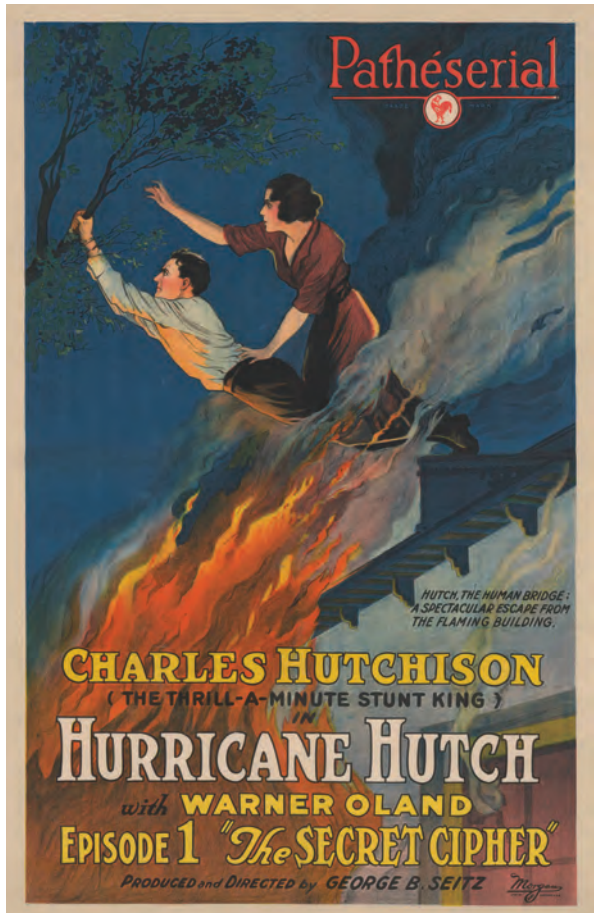
Hurricane Hutch (George B. Seitz, 1921)