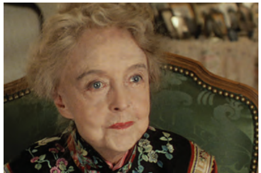
The Enemy (Fred Niblo, 1927)