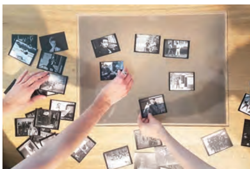
Le Lucerna de Prague © Droits réservés Fondation Jérôme Seydoux-Pathé, 2021 © Michel Denancé Atelier "Ciné-Puzzle" © Droits réservés