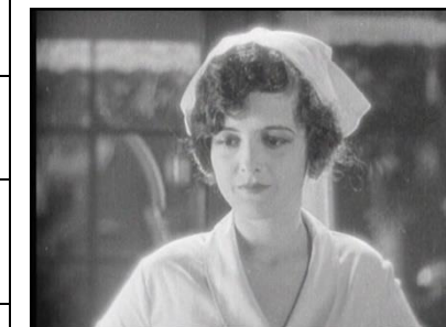
Oh, doctor!