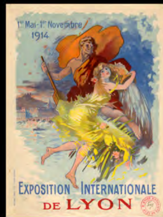
Affiche de l'exposition internationale de la ville de Lyon réalisée par l'inventeur Jules Chéret.