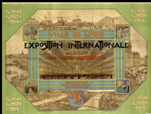
Affiche de l'exposition internationale de la ville de Lyon réalisée par Tony Garnier en 1913 représentant la cité moderne.