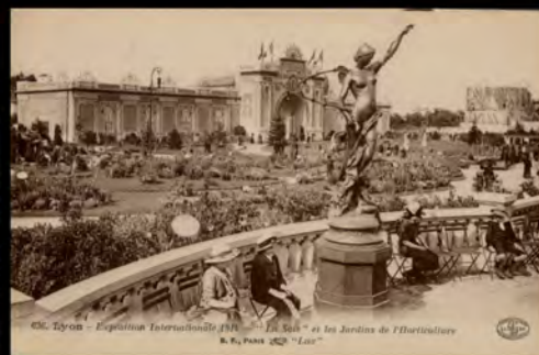
Carte postale Lyon Exposition Internationale 1914, La Soie et les Jardins de l'Horticulture