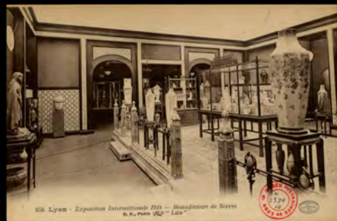
Carte postale Lyon Exposition Internationale 1914, Manufacture de Sèvres