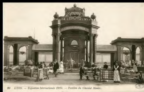
Lyon Exposition Internationale 1914, Pavillon du Chocolat Menier