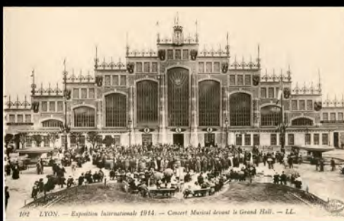
Carte postale Lyon, Exposition Internationale 1914, Concert musical devant le Grand Hall; LL © musées Gadagne