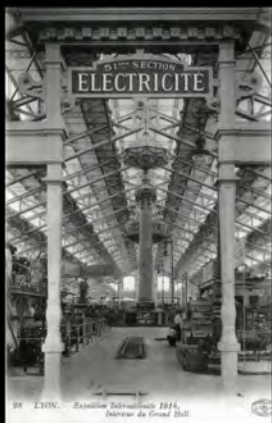
Lyon Exposition Internationale 1914, intérieur du Grand Hall