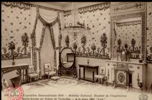
Carte postale Lyon Exposition Internationale 1914, Mobilier National, Boudoir de l'Impératrice