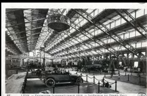
Lyon Exposition Internationale 1914, intérieur du Grand Hall