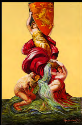
Affiche de l'exposition internationale de la ville de Lyon en 1914 réalisée par Leonetto Cappiello.