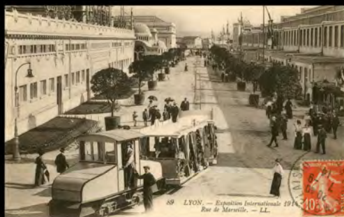
Carte postale Lyon Exposition Internationale 1914, Rue de Marseille